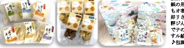
利用者の好きな餅や和菓子で、お祝いやプレゼントに最適です。

春の贈答の季節を迎え、今年もたくさんのご進物のご注文をいただきました。利用者の皆さんは張り切って製造に取り組まれ、一つひとつ心を込めて商品をお届けすることができました。たくさんのご注文、誠にありがとうございました。また本園では、記念品や贈答用商品の詰め合わせなど、用途に応じたご注文を承っております。ご予算に合わせてご用意いたしますので、どうぞお気軽にお問い合わせください。