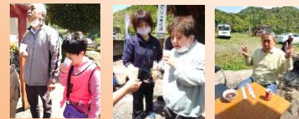
地域の皆さんありがとうございます！

今年も城井地区の3か所にお参りをさせて頂きました。利用者の皆さんは地域の方々との交流を楽しみながら笑顔でお参りをした後、お接待を頂きました(^_^) 心温まるひとときを過ごすことが出来ました。