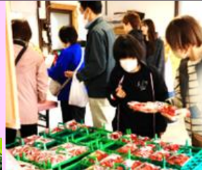
このいちご 美味しそう