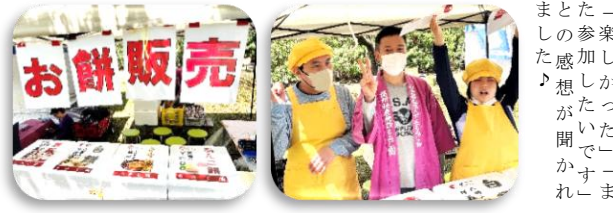
「楽しかったー」まましたー「またかー」

4月25日(土)、第21回中津みなとふじまつりに参加し、お餅とお菓子の販売を行いました。当日は天候に恵まれ、多くの方にお立ち寄りいただきました。お客様から「いつも買っています。頑張ってください」と温かいお言葉をいただく場面もあり、利用者の皆さんにとっても励みにつながる一日となりました。