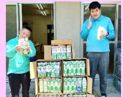
「遠方からの協力に利用者みなさん「量の多さにびっくりでした。」