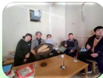
オーナーさん(左から2番目)と記念撮影

生活介護で栽培した「へちま」を購入し販売してくれている「GIGUE(ジグ)」(町内柿坂で日用品や食料の販売や喫茶を営業)さんを訪問しました。店内はおしゃれで落ち着く雰囲気でした。自然にやさしい商品をたくさん置いています。商品化したへちまを見たり、コーヒーを飲んだり、のんびりと過ごさせていただきました。