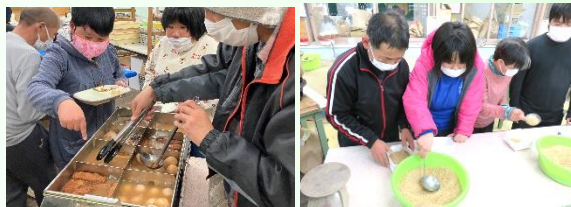
お楽しみ会では、職員が考えたオリジナルのゲームで楽しみました!(^^)! 大盛り上がり!