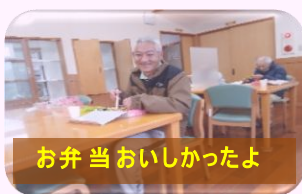
お弁当おいしかったよ

1年の労をねぎらって12月29日(月)仕事納めの日は、豪華なお弁当での昼食です。令和8年も元気に登園してくださいね。