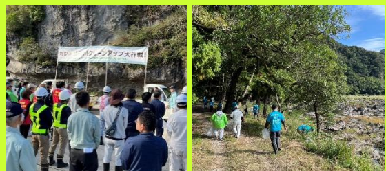
クリーンアップ大作戦での様子

参加された利用者の皆さんは地域の方々と共同で美化活動を行うことで、地域美化への関心をより高めるよい機会となりました。