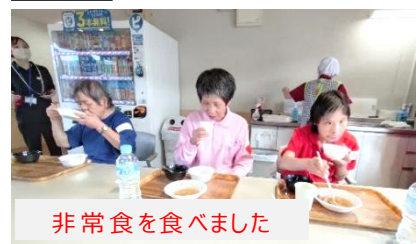
非常食を食べました