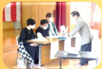
熊谷育成会会長から鉢植えのプレゼントがありました