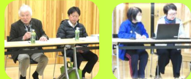
↑各団体発表時の様子 ↓会議の様子

今後とも会議を通して情報を共有し、行政、地域、施設が集まり同じ課題を改善、解決に向けて話し合う場として皆さんと地域のことを考えていきたいと思えます。