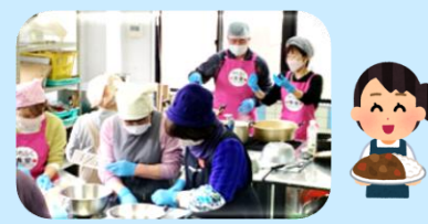
↓本の読み聞かせ、ミニゲームなどを行い楽しみました。

また、やちふく食堂においては、地域の方々より食材や手作りの菓子等の提供もしていただき、心より感謝申し上げます。本会は、これからも子育て世帯を応援させていただきます。次回は夏休みを予定しています。