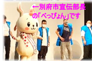
←別府市宣伝部長の「べっぴん」です