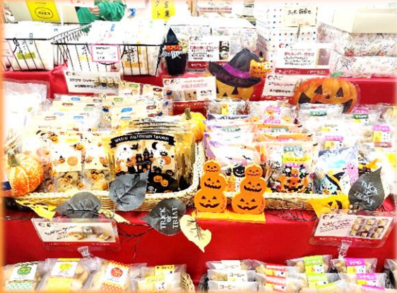
↓オアシス春夏秋冬のお土産売り場の様子