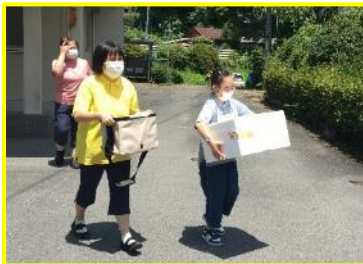
「ランチ配達お願いします！」(8/1)