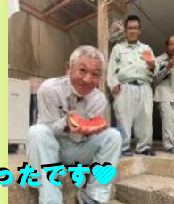
あまくておいしかったです♡